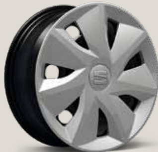
Urban 30/1 R