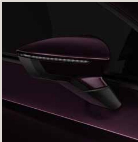
Boheme Purple 2 R St XE FR