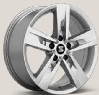
Dynamic 30/2 FR