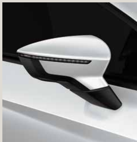
Nevada White 2 R St XE FR XP CU