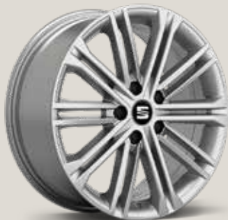
Dynamic 30/1 XE