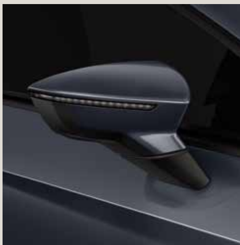
Magnetic Tech 2 R St XE FR XP CU