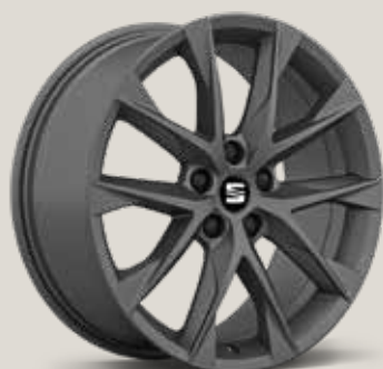
Performance Machined Atom Grey XP