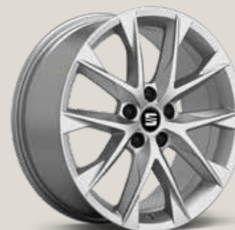
Performance 30/1 FR