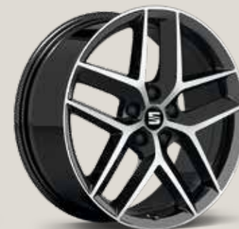
Performance 30/2 Machined FR