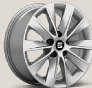
Design 30/2 St