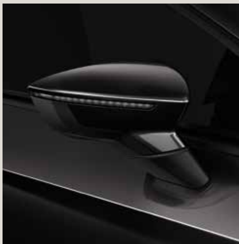
Midnight Black 2 R St XE FR XP CU