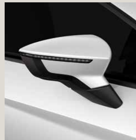
White 1 R St XE FR XP