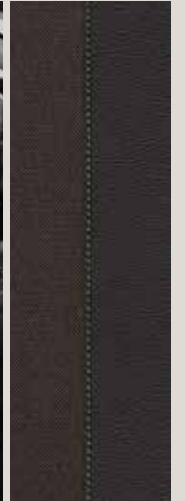
Cloth Teddy/Mikelly Sport seats DE