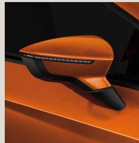
Eclipse Orange 2 R St XE FR XP