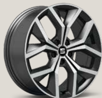
Performance Machined Atom Grey XP