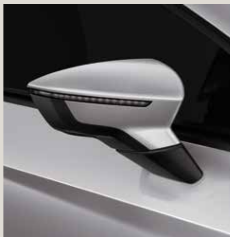
Urban Silver 2 R St XE FR XP CU