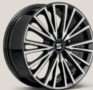
Dynamic 30/4 Black High Gloss XE