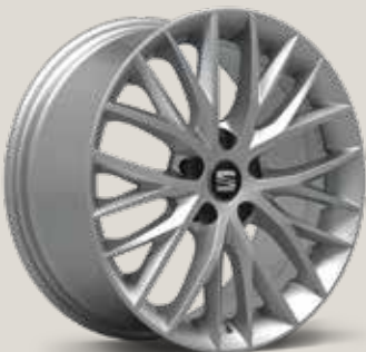
Dynamic 30/3 St