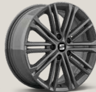
Dynamic 30/1 XE