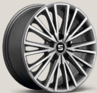
Dynamic 30/4 Atom Grey St