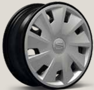
Urban 30/1 R