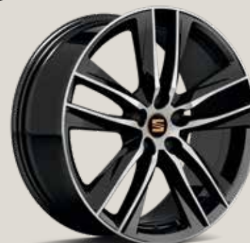
CUPRA 30/2 Black High Gloss CU

Reference FR Style ST Xcellence XE FR FR X-PERIENCE XP CUPRA CU Στάνταρ ■ Προαιρετικά ■