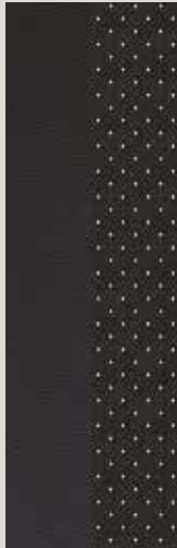
Leather Black Sport seats LE + WL1