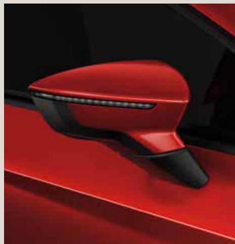
Desire Red 2 R St XE FR CU