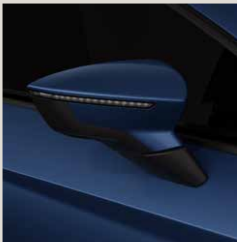
Mediterraneo Blue 1 R St XE FR XP CU