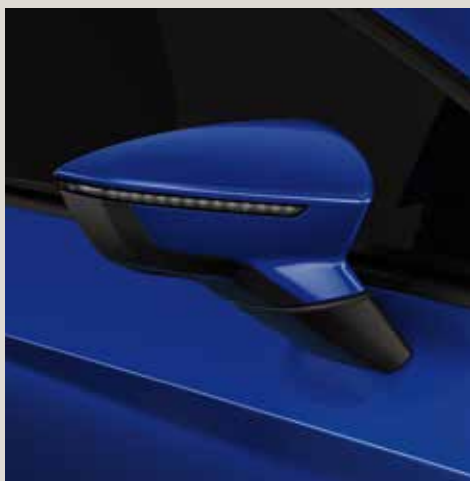
Mystery Blue 2 R St XE FR CU