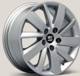
Design 30/1 R